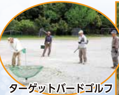
ターゲットバードゴルフ