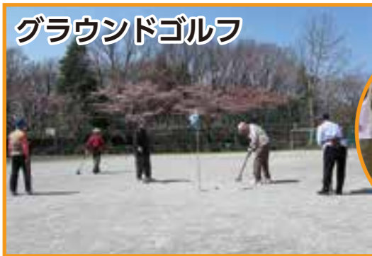
グラウンドゴルフ