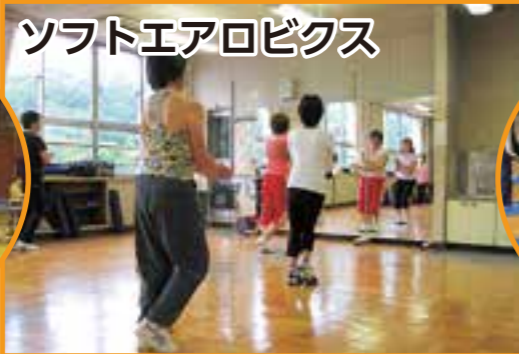
ソフトエアロビクス