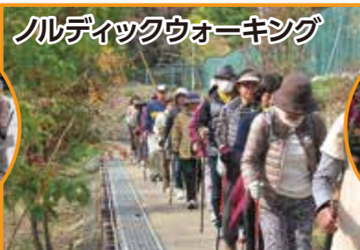
ルディックウォーキング