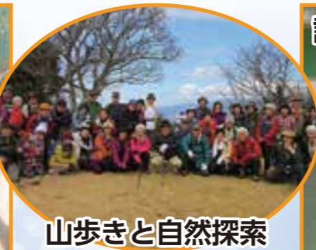
山歩きと自然探索